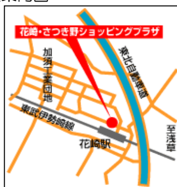
東武東上線「花崎」駅前（ロータリー）