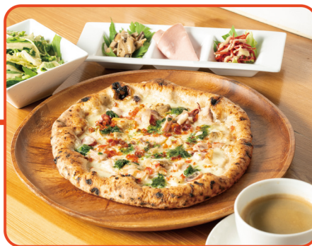
海香のピッツァマーレ／平日3,400円 休日3,600円(ランチセット／税込)