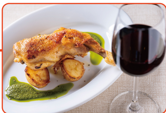
国産鶏骨付もも肉のコンフィ／2,178円(税込)