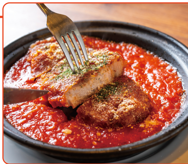
ミラノ風ポークカツレツ／1,309円(税込)

お 子様連れ歓迎の温もりある空間で、本場の味を提供するダイニングバー。店内にはベビーチェアやキッズスペースが完備されており、家族の団欒はもちろん、ママ友との会話にも花が咲きます。一方で、夜は温もりの中に艶やかさが漂うイタリアンバルへと表情を変えるので、ご夫婦でゆったりと更けゆく時間を愉しむことも。自慢のもっちり生パスタや熱々の石窯ピッツァに加え、イタリアの息吹を感じる一品料理も豊富。提携ワイナリーと共同開発したオリジナルワインとともに、お好みのアラカルトを心ゆくまでご堪能ください。