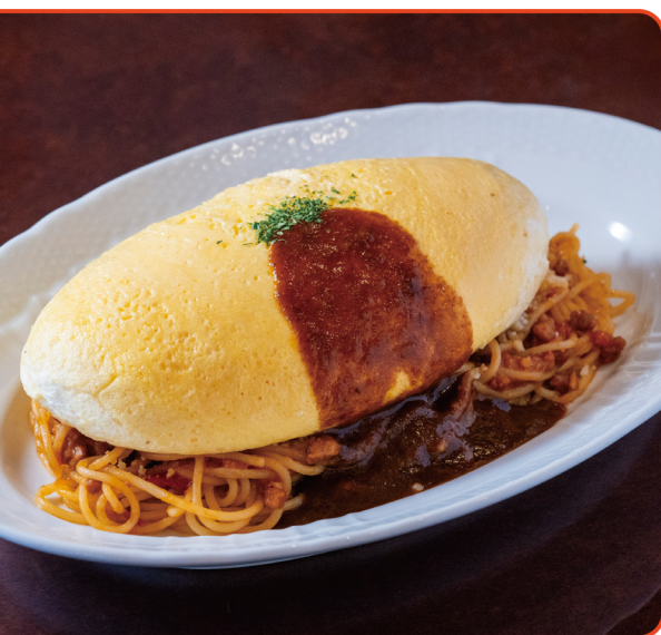
ミートソース&スフレオムレツ／1,350円(税込)