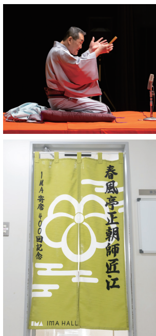
左・日曜日の早朝寄席という草創期を経て、金曜日の夜公演が定着した今日まで、IMA寄席は時代の変遷と共に歩みながら、その歴史を積み重ねてきました。 右下・IMA寄席の開催400回を記念して贈呈されたのれんは、現在も毎公演時、楽屋の前に掲げられています。